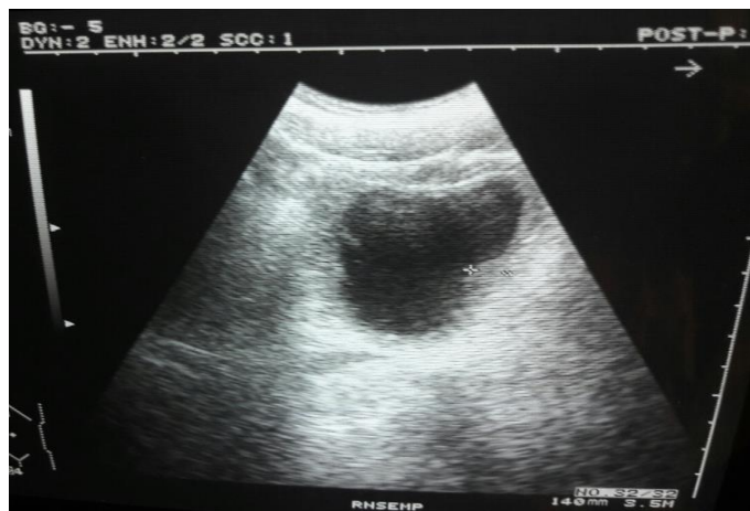
Рис. 1. (Fig. 1).