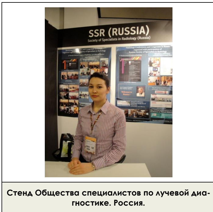
Стенд Общества специалистов по лучевой диагностике. Россия.