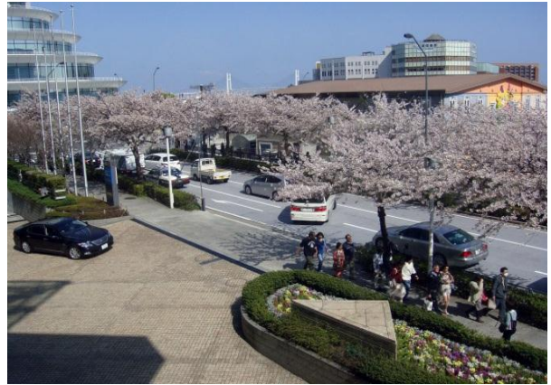
Везде цветущая Сакура!