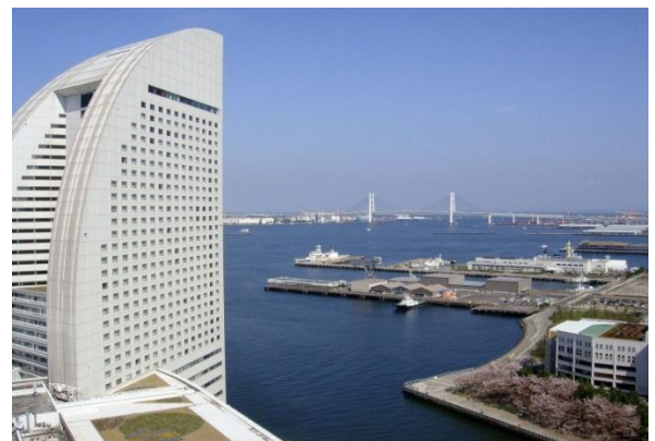
Вид на морские ворота Йокогамы.