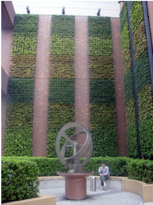
Вертикальный сад Йокогамы.