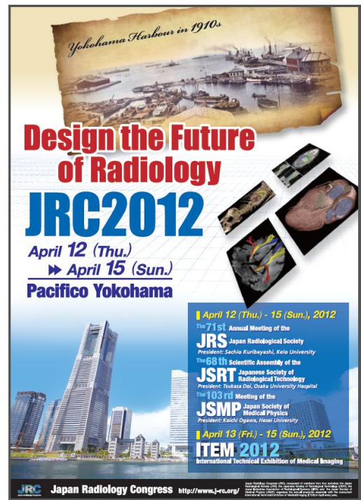
Основной постер конгресса.