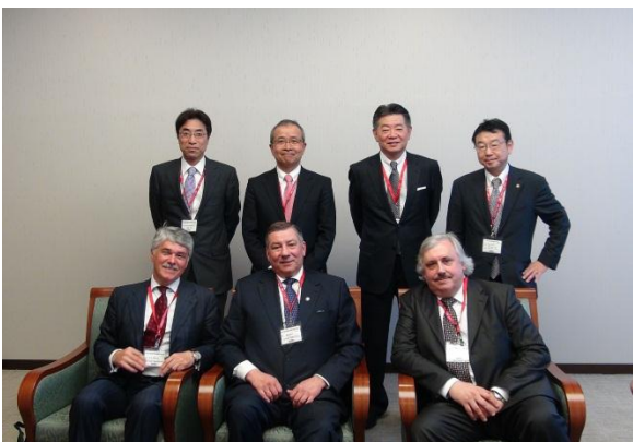
Встреча Российской делегации с руководством Общества радиологов Японии.