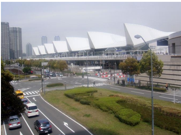
Вид на конгресс центр.