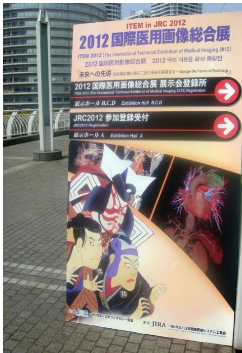
Добро пожаловать на конгресс!