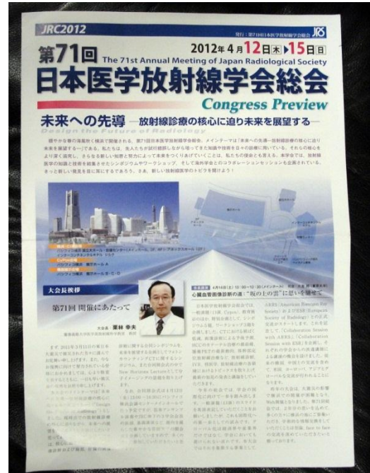
Ежедневная газета Конгресса JRC2012.